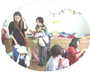
「どれにしようかな～」

11月16、17日の2日間にわたって不用品交換会「とりかえっこ」を開催しました。地域の皆様のご協力を頂き、子ども衣料をはじめ小物やおもちゃなど多くの品物が集まり、かわいくレイアウトされた会場は、のべ150人の来館者を迎えて連日熱気ムンムン・・・子育てママは、山のような服の中からわが子に似合う形やサイズ選びに夢中で、シニアの方々は、お孫さんのお土産にと愛くるしいぬいぐるみの品定めに余念がありません。子育てのよもやま話に盛り上がり、時間のたつのを忘れる癒しの空間となりました。