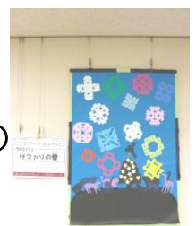
作品名：サファリの雪