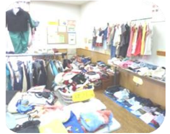
「所狭しと並ぶ子ども服」

今まさにトレンドなライフスタイルとして注目される“エコ”。良い物を大切に、そして有効に再利用していく“人と物の「輪＝和」”がさらに広がっていくことを願いつつ・・・