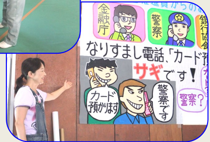
会場設営係りの皆さんによる準備作業