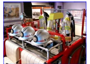
市民防災センターの展示物