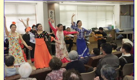
オレーッ みんな興奮！