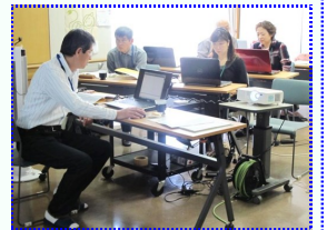
桂台地域ケアプラザでのパソコン講座