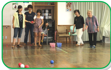
決勝はチームAMR(写真左)が同点プレーオフの結果、チームハ木を破り見事優勝しました