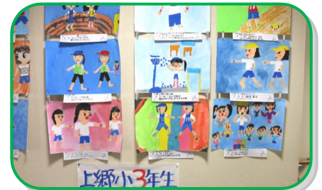
今回も上郷小3年のみなさんが運動会の元気な様子を描いて下さいました

ホアピリアレアのみなさんのウクレレ演奏、歌とおしゃべりで楽しませて下さいました。AKBの「恋するフォーチュンクッキー」ではを踊りを添えて下さいました