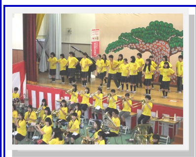
— 昨年の敬老の集い —

日 時 : 9月19日 (月・祝) 午後2時~4時 場 所 : 上郷中学校体育館 内 容 : 1部 式典 2部 お楽しみ会 主 催 : 上郷西地区社会福祉協議会 共 催 : 上郷西連合町会