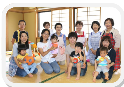
— 6月17日参加の皆さん —

参加費: 100円 開催日時: 毎月第3金曜日 10時~14時 場 所: 尾月自治会館 問い合わせ先: 本田桂子 893-4193