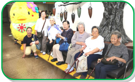
ぬくっぴーが玄関でみなさんをお出迎えです