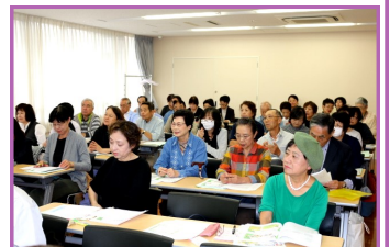
★連絡会参加メンバーのみなさん