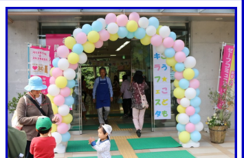
★ウェルカムゲート