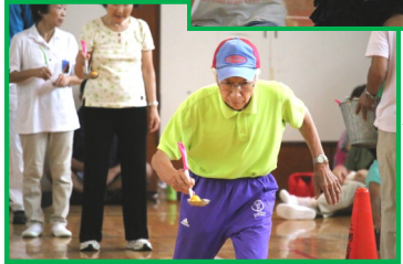
★スプーン ・レース