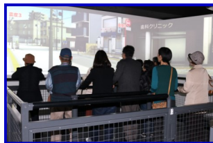
★地震シミュレーターを体験

12月17日、上郷西地区支えあい・つながるプラン推進会議・防犯防災委員会は横浜市民防災センターの見学を企画いたしました。見学には上西地区から総勢37名が参加し、「災害シアター」ではいま横浜を地震が襲ったらを映像で体験し、「地震シミュレーター」では過去の大地震の激しい揺れを、「火災シミュレーター」では消火器操作を体験するなど、地震がきたときにはどのような行動をとるべきかをいろいろ学び、大変有意義な一日でした。