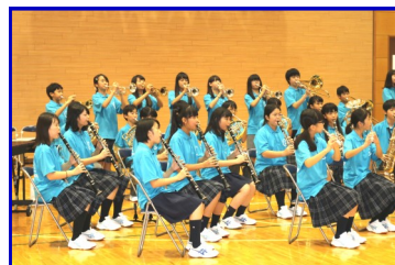
★上郷中学校「吹奏楽部」のみなさん