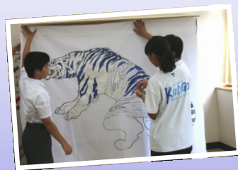
★龍虎の絵と、つるし雛など、飾りつけの製作を担当してくれた上郷中学校の生徒会と美術部員のみなさん