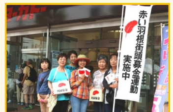
《10月3日のボランティアの方々》